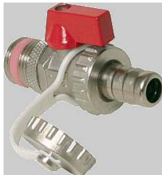
Aflaatkraan met O-ringdichting 1/2 KFE 15 SD