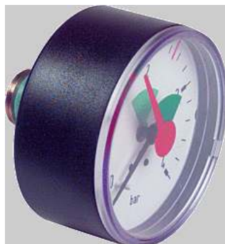
Manometer CV axiaal gr/rd diam.63 0-4 bar 3/8 M