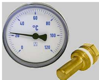
Thermometer diam.63 0-120 °C +huls 1/2 50mm D600