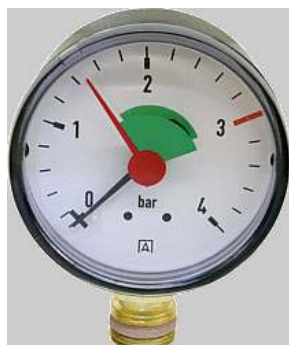
Manometer CV radiaal gr/rd diam.63 0-4 bar 3/8 M